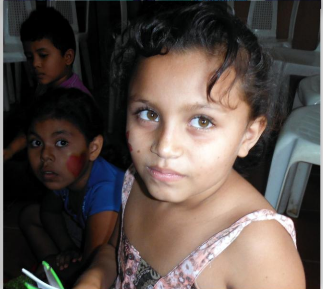
Menores del proyecto Basurero Nandaime participando en actividades recreativas