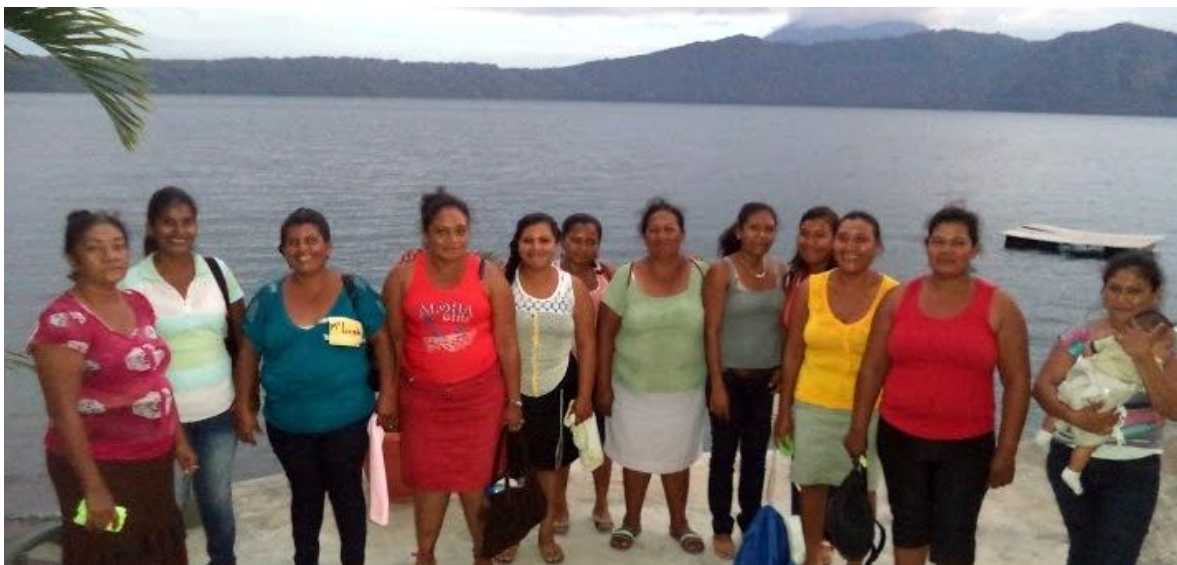
Madres de los Proyectos Basurero la Joya y Basurero Nandaime participando en Encuentro de Evaluación anual del Proyecto con personal de Children's Wellness Fund INC en Laguna de Apoyo, Diciembre 2014.