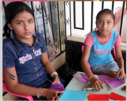
Menores del Proyecto La Joya participando en actividades educativas