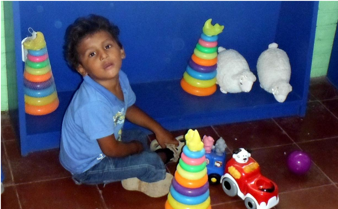
Menores atendidos en la Sala de Estimulación Temprana de la Escuela Especial San Vicente de Paúl