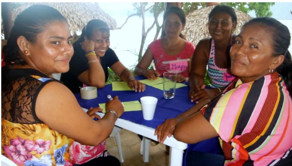
Madres y Menores de Proyecto Basurero Nandaime participando en actividades educativas

Se beneficiaron a 16 Familias del Basurero Municipal de Nandaime con 16 Paquetes Mensuales de Alimentos en el I, II y III Trimestre y en el IV Trimestre se entregaron 14 paquetes mensuales por el retiro de 2 familias, para un total de 186 paquetes al Año .