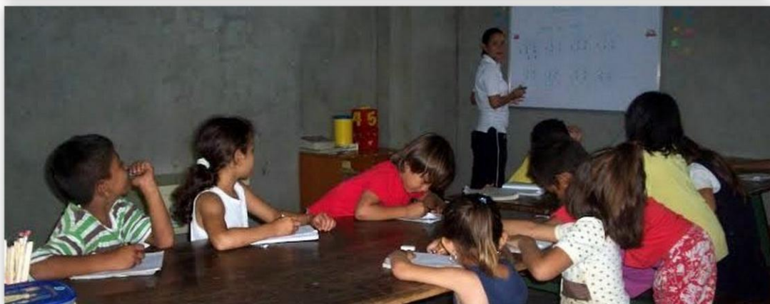
Actividades de pintura y aprestamiento escolar desarrolladas en el Centro Obras Sociales Sor María Romero