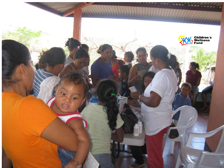
Puesto de salud de CWF ubicado en la comunidad del Manchón.

En este mes de Marzo 2009, el personal de salud de la Fundación, Children's Wellness Fund (CWF) que trabajaron en Puesto, ubicado en la localidad del Manchón, del municipio de Nandaime, realizó actividades encaminadas a mejorar la situación de salud de los pobladores del Manchón y sus localidades más cercanas.