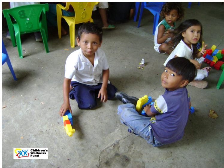
Preescolar De Santa María comunidad de la Isla Zapatera.

Durante el mes de Marzo se mantuvo la retención escolar de los niños que apoya la Fundación CWF en las escuelas de Isla Zapatera (Cañas y Santa María) y en Santa Ana en el municipio de Nandaime.