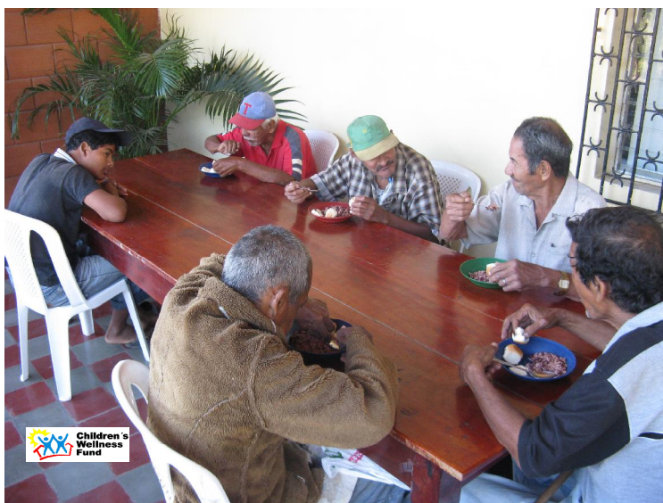
Ancianitos del Comedor Infantil CWF.