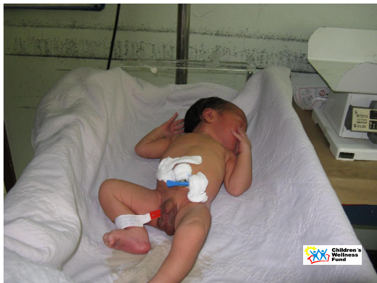
Niño apoyado por CWF en sala UCI-PEDIATRICA

En el Hospital amistad Japón Nicaragua en este mes se atendieron a Treinta y tres niños, los que fueron apoyados: cinco en el servicio de Neonatología, diez niños se atendieron en la Sala de UCI Pediátrica y dieciocho niños a la sala de Pediatría.