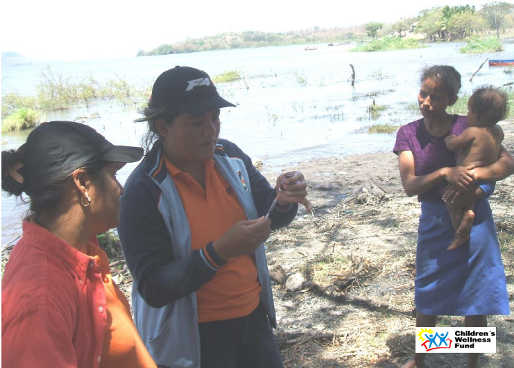
Personal de Salud de CWF, realizando actividades de salud en Santa María. Comunidad de la Isla de Zapatera.

El Personal de Salud de la Isla Zapatera que laboran para la Fundación, Children's Wellness Fund (CWF) , en el mes de Marzo continuaron realizando las actividades de promoción, atención médica en los tres sectores de la Isla: Terrón Colorado Santa María Guinea y Caña, preservando en este periodo la salud de la Población en general y Principalmente de la Niñez Adolescentes y Mujeres.