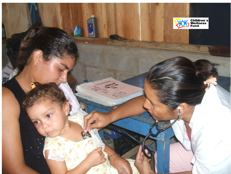
Niña de la Comunidad de Terrón Colorado es atendida por enfermedades respiratorias.