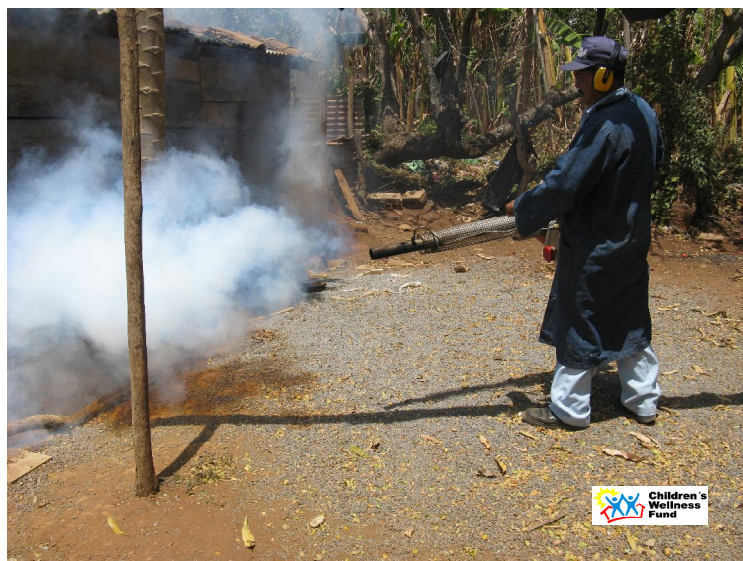
Fumigación CWF-MINSA en la comunidad del Manchón.