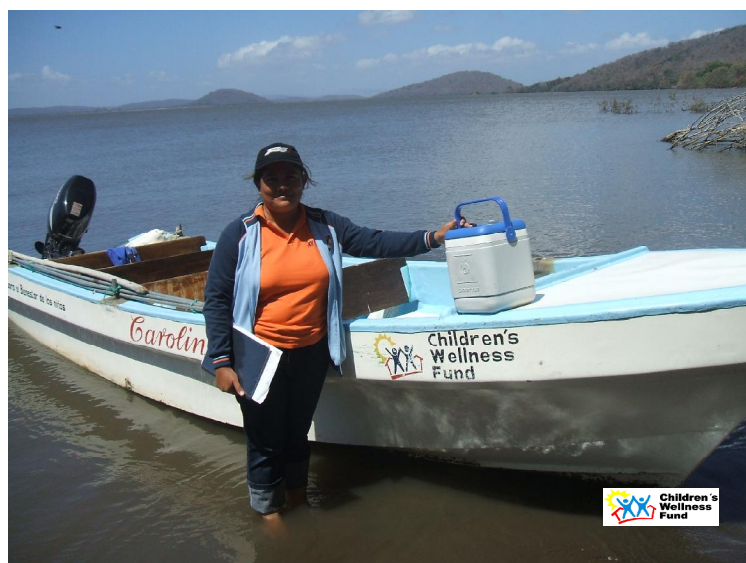
CWF de manera sistematica efectua vacunación en la Isla de Zapatera.