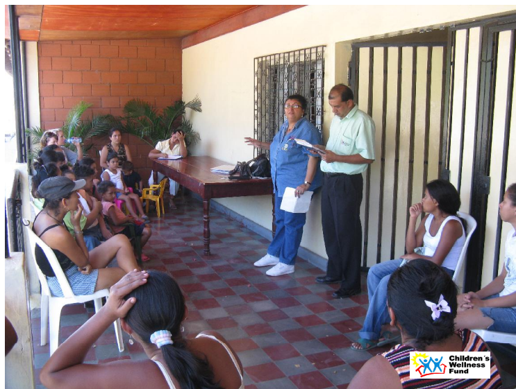
Charlas a madres del comedor infantil CWF