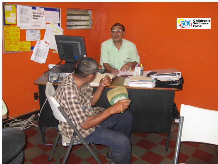
Atención medica a miembros del comedor Infantil CWF