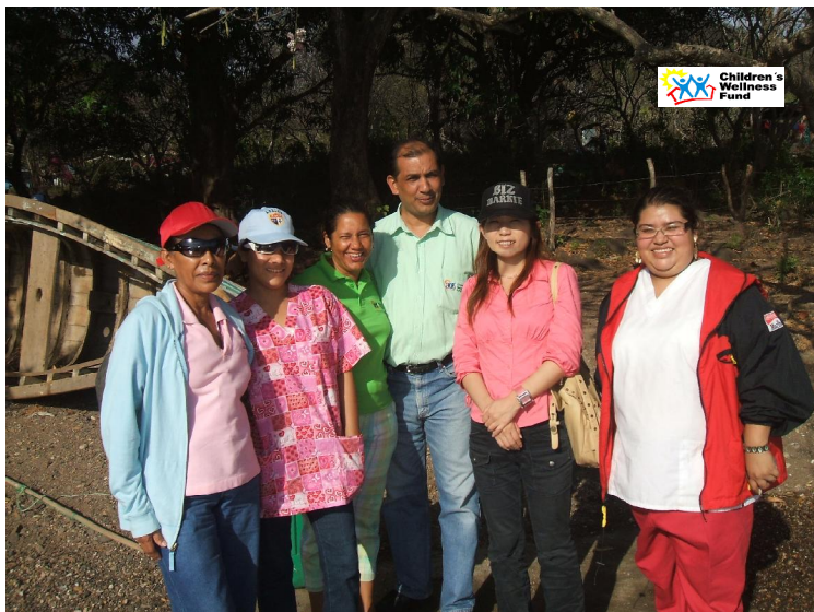
Personal que participo en la 1era feria de salud a las mujeres, Niños y adolescentes en Zapatera.

El personal de salud, educación y desarrollo de la Fundación, Children's Wellness Fund (CWF) con el apoyo del personal del MINSA, Brigada Movil Ixchent realizo una Feria de Salud para que las mujeres de las comunidades de los Sectores de Santa Maria Terron Colorado Cañas y Guinea pudieran ser atendidas integralmente, con atención Especializadas con Ginecologo a 22 mujeres en climaterio, valoraciones Ginecologicas a 38 mujeres por medicas generales, se realizaron 37 tomas de PAP, aplicacion de vacunas y se realizaron 17 chequeos odontologicos.