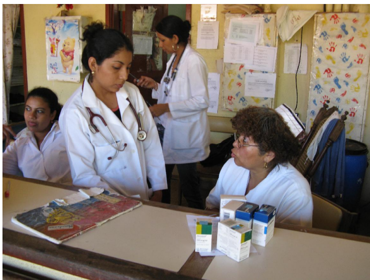
UCI-PEDIATRICA del Hospital Amistad Japón de Nicaragua.

En el mes de Febrero la Fundación Childrens Wellness Fund CWF a través de la gestión de la gerencia de salud se abasteció la sala de pediatría y neonato con medicamentos y equipamiento que mejoran la calidad de atención de los pacientes que estuvieron internos en el Hospital Amistad Japón , en este periodo.