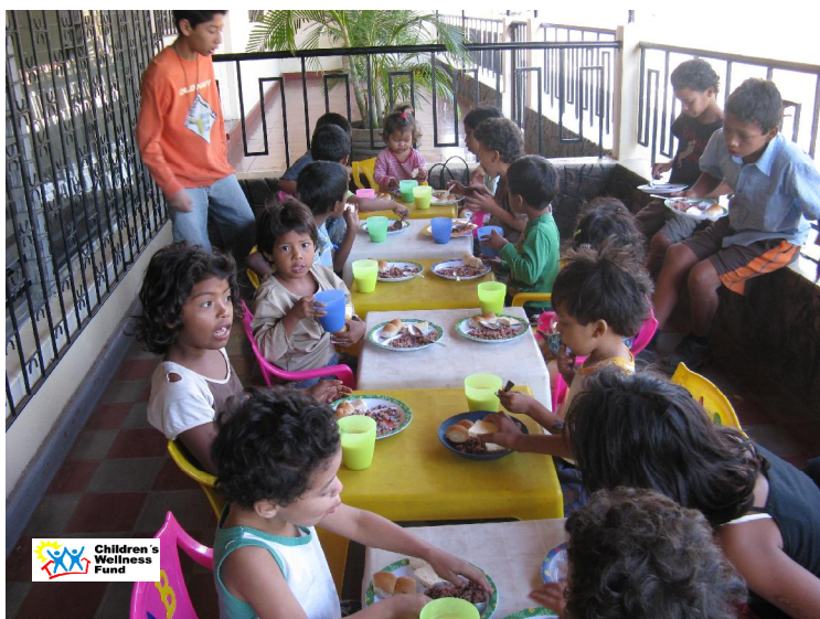
Niños del comedor Infantil cwf