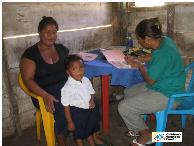
Atención medica a niña de la Isla de Zapatera.

todas las consultas Medicas 174 fueron brindadas a niños y Adolescentes que representa el 77 %..