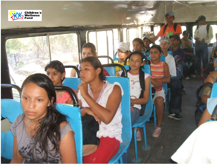
Los estudiantes del Proyecto Secundaria son trasladados en el Bus escolar.

Por otro lado la Fundación CWF, además del apoyo que se les brinda con el combustible y lubricante, también se les dota de un paquete alimenticio mensual que viene a amortiguar las necesidades que los jóvenes no perezcan de su alimento.