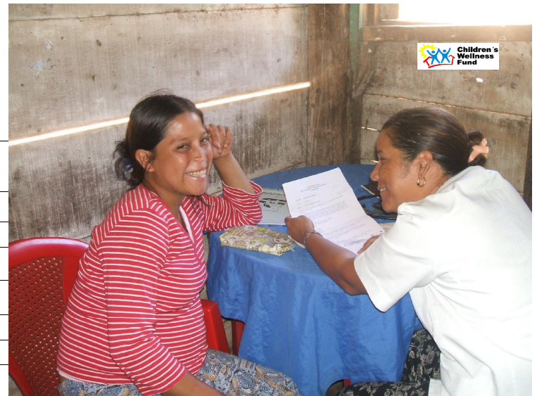
Control Prenatal a mujer Embarazada de la comunidad de Santa María.

En el Mes de Marzo el numero de mujeres embarazadas que acudieron a los Controles Prenatal incremento en un 75 % en relacion al mes anterior, en este periodo el 28 % del total de embarazdas fueron capataciones ( en el I y II Trimestre del embarazo.) y el 72 % de las ambarazadas realizaron controles subsecuentes.